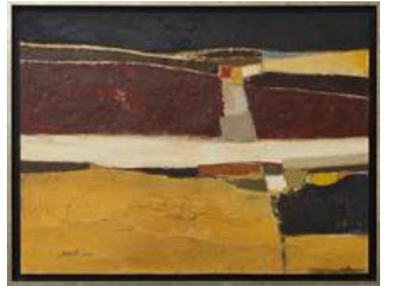
بدون عنوان "تجريد"، 1973 / فؤاد بلامين، المغرب مواد مختلفة على لوح، 97x72سم