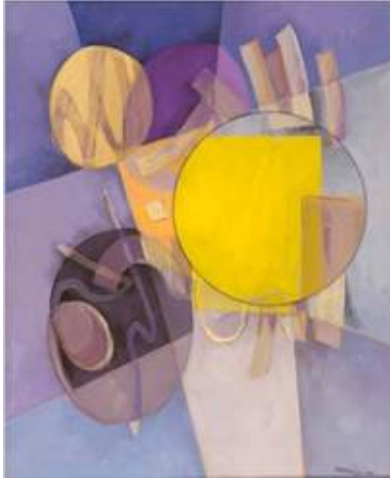
بسم الله، 1983 / محمود حماد، سوريا 80 سم x ألوان زيتية على قماش، 99