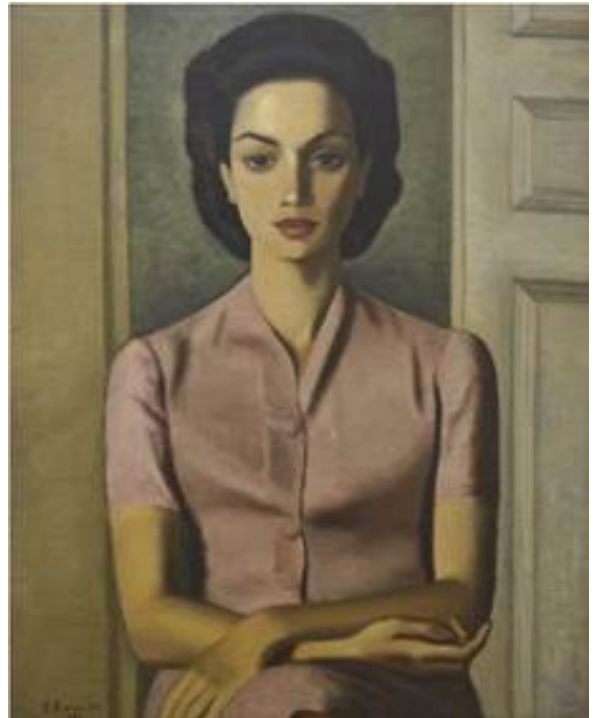
لوحة بورتريه الأنسة A.C، 1939 / حزقيال باروخ، مصر ألوان زيتية على ورق مقوى، 65x80 سم

■ الحجز المسبق ضروري عبر الاتصال على 06-5197259 أو البريد الإلكتروني Academics@sma.gov.ae