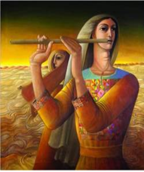
نغمات حزينة، 1977 / سليمان منصور، فلسطين ألوان زيتية على قماش، 90x87 سم

معرض مسيرة قرن: إضاءات من مؤسسة بارجيل للفنون متحف الشارقة للفنون 12 مايو 2018 - 30 مايو 2023