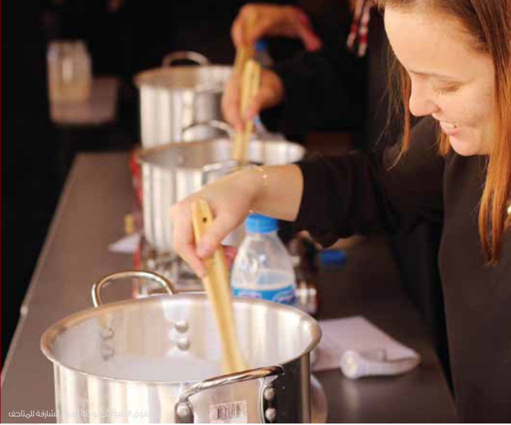
تحت إشراف الطبخ، بصحبة أمينة الشارقة للمتاحف